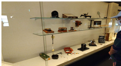
創業以来数々の器械類を開発