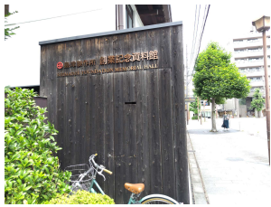
資料館は創業時の本社.今は登録有形文化財

受講生自身が計画し実施する校外学習(第1回)として島津製作所の資料館を見学しました。島津製作所は明治はじめに創業し理化学器械などの製造販売をしてきた会社でありこの資料館には創業以来の製品や資料が多数展示されており日本の近代科学技術発展過程の一端が見られました。