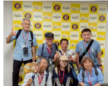
インタビュースペースにて