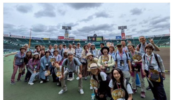
グラウンドは試合前の整備中でした

今回の感想 パナソニックスタジアムから予定が変更となり、タイガースファンが喜ぶ見学になりました。当日試合前の選手に会えるかも？の期待は叶わずも、実際のベンチや球場の一部に入れて皆満足でした。