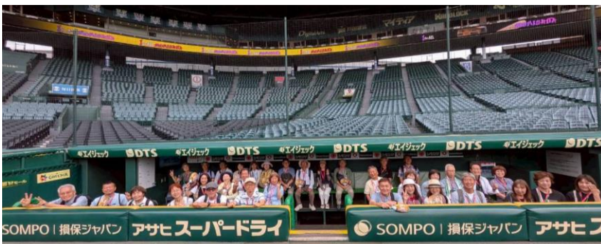
3塁ベンチは全員が入れる広さでした