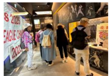
阪神タイガースの歴史を見学