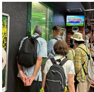
見学ではブルペンが見える