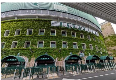
リニューアルした緑がきれいな蔦