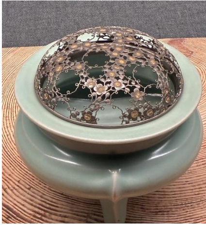
砧青磁袴腰香炉 銘 香雪