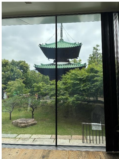
藤田美術館より見る「藤田邸跡公園」

藤田美術館は学芸員の方が何点か説明して頂き、その他は音声ガイドもあり、とても良く分かって良かったです 素敵な一日でした