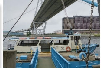
港区側の渡船場と 阪神高速湾岸線