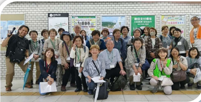
大阪港駅に溢れる笑顔、笑顔