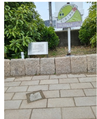
路面に標石(ひょうせき)が埋設

天保2年(1831年)安治川の川底を浚渫し、その土砂 でできた山。当時は約20mの高さで桜の名所。 幕末に砲台を設置するため山を削ったり、さらに 地盤沈下で低くなり日本一低い山に。 それが平成26年(2014年)に仙台市の日和山にその座 を奪われることに……涙💧 しかし 二等三角点4.53mの設置場所では日本一の低山。