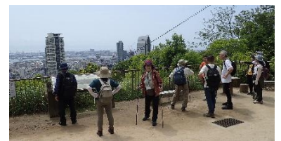
途中の「みはらし展望台」 から神戸の街を一望