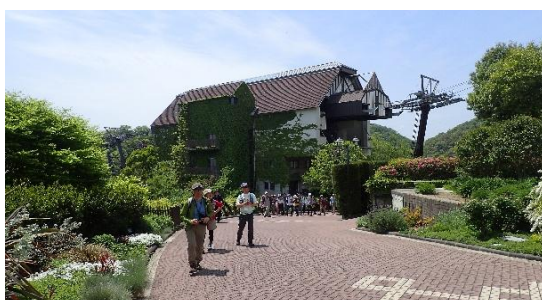
ハーブ園到着、「風の丘中間駅」通過