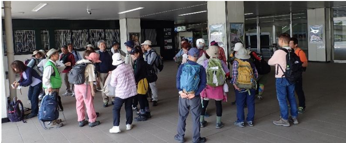
新神戸駅集合 (この後駅の北側からハイキング道へ)