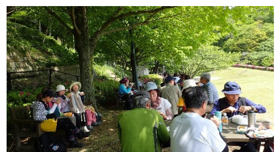
「風の丘芝生広場」で昼食