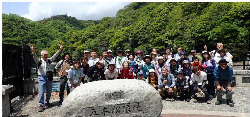
貯水池 (ダム湖) を背景に「五本松堰堤 (通称布引ダム)」で集合写真