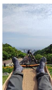
ハンモックに 揺れる人も