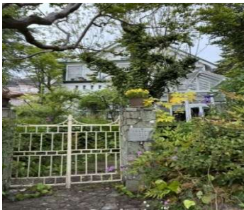
景観重要建造物第 3 号 日下邸