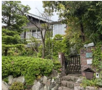
景観重要建造物第 4 号 栗原邸