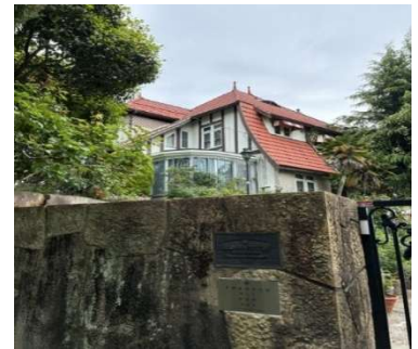
景観重要建造物第 2 号 正司邸（元宝塚市長宅）