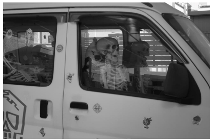
5-駐車中の軽自動車