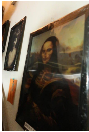
11-階段横の不思議絵