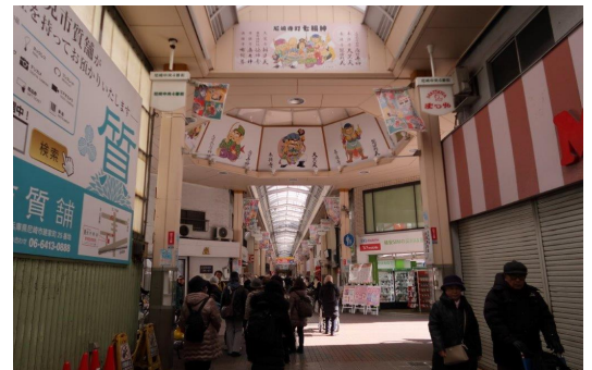
15-帰路の尼崎中央商店街