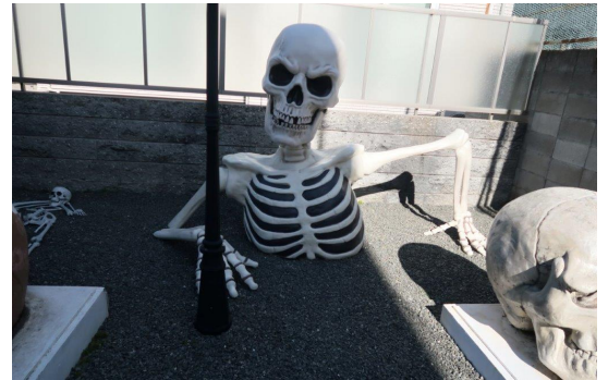
13-中庭に巨大オブジェ

見学後は12時前に阪神尼崎へ向け出発、30分ほどかけて尼崎市内を散策し、駅前の商店街内で解散しました。「ばんば親子と歩こう」の街歩きは今月で終わりとのこと。ふみお先生、哲平先生、毎月楽しい散策の時間をありがとうございました。2月の講演を楽しみにしています。