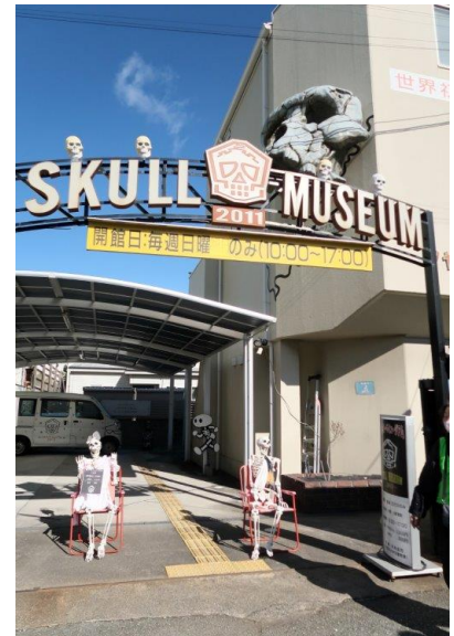
3-シャレコーベミュージアム に到着