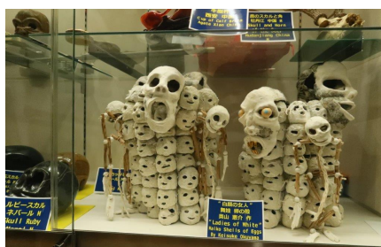
10-本物の頭蓋骨やレプリカ鑑賞