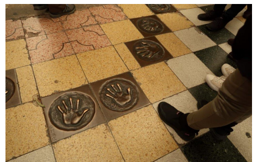
16-解散前に懐かしい阪神球団選手の手形発見