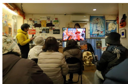
9-3階で開館のエピソード等を聞く