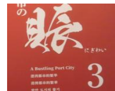
港湾都市の賑わい