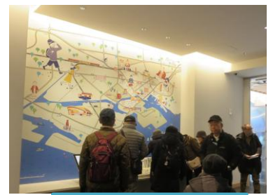
マップギャラリー

兵庫津の移り変わりを「古代」、「中世」、「近世」、「近代」の4つに分け展示されている。