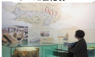
出土した巨木と工法の紹介