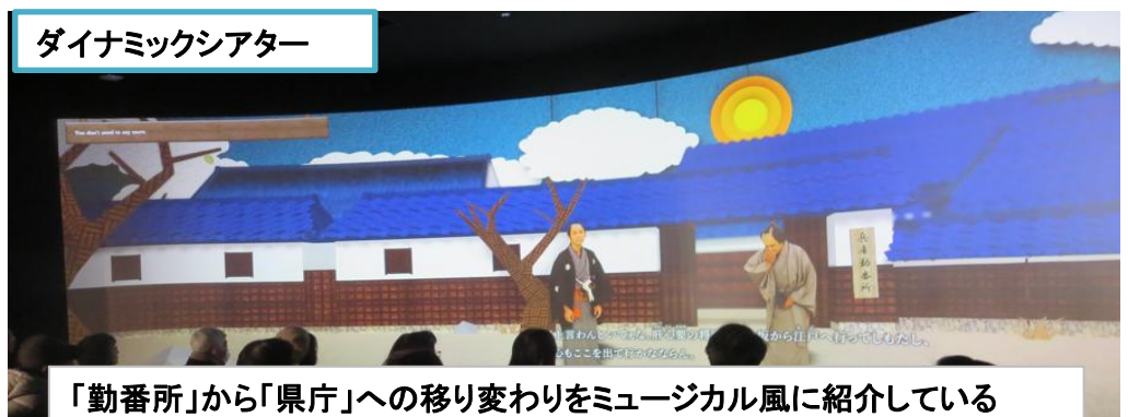
「勤番所」から「県庁」への移り変わりをミュージカル風に紹介している