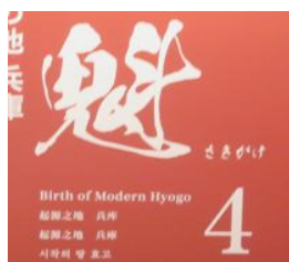
はじまりの地 兵庫