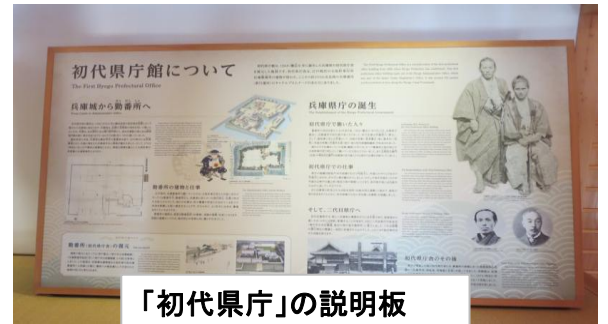
「初代県庁」の説明板