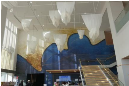
入館すると天井から「北前船」が出迎