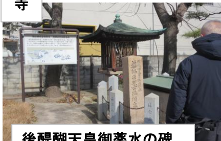
後醍醐天皇御薬水の碑