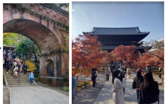
峠を超えて、水路閣、南禅寺に到着！

今回の感想 天候にも恵まれ、晩秋の紅葉を楽しみながらのコースでした。 山越えのハイキング路はキツイ所もありましたが、誰も怪我することなく無事に歩ききりました。 山から降りて水路閣や南禅寺の賑やかな景色はまるで別世界でした。