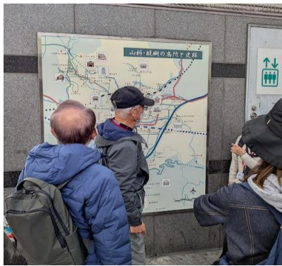
山科駅前のマップで旅程を確認

10:15山科駅集合⇒11:00毘沙門堂⇒琵琶湖疎水沿いを歩く ⇒12:00山ノ谷橋着(昼食)⇒12:40山ノ谷橋出発⇒七福思案処 ⇒水路閣⇒14:00南禅寺。解散