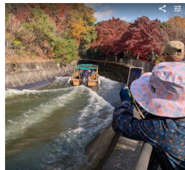
時折、遊覧船が行きかいます