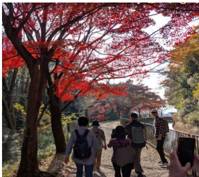
琵琶湖疎水に沿って歩く