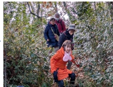
林の中を突っ切って！