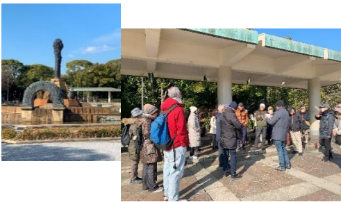
緑地公園の噴水付近で集合

オリエンテーリングは服部緑地内にある常設コースを利用します。 地図等でポイントを探し出し、ゴールへ向かいます。どこのポイントを見つけるのか、 どのようなルートで回るのか等は、グループで相談し、高得点を取ってください。