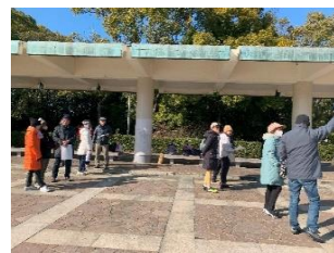
グループに分かれて出発！