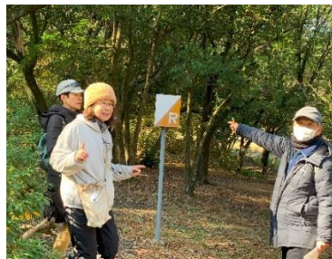
ポイント見つけた！