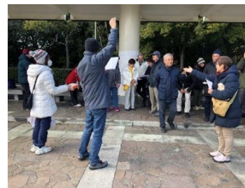
優勝チームの発表