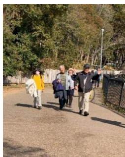
全部回って集合場所へ