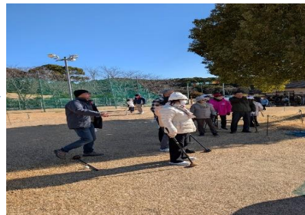
強い風の中のプレイ(遅れ気味)