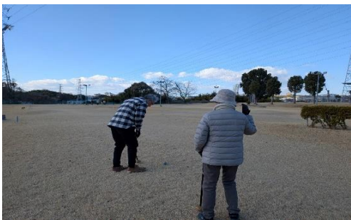
ホールインワンできるかな