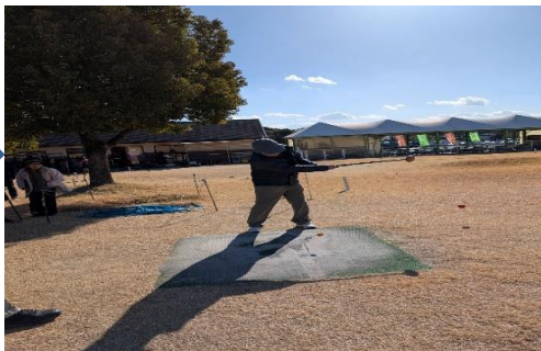
INとOUTに分かれてスタート