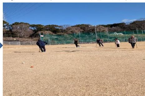
上手くプレイ出来ているかな