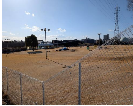
ストックとボールを入手