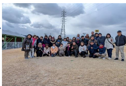
プレイ終了後の全体写真撮影