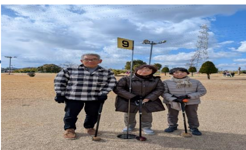
2班のメンバーの皆さん