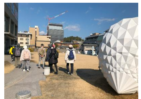
前方で五重塔修理工事