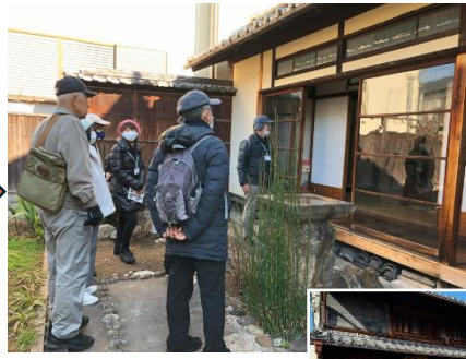
奈良町にぎわいの家