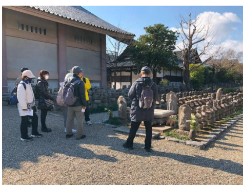
奈良市ならまちセンター で解散後、昼食