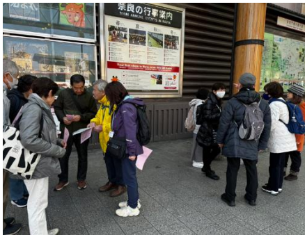
近鉄奈良駅行基広場で班分け