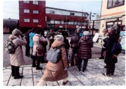
市営小幡観光駐車場にて