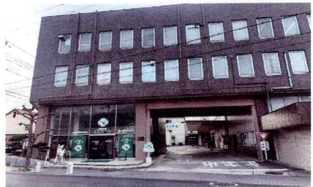
メンタム資料館 近江兄弟社 本社1F