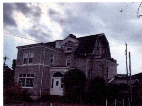
吉田悦蔵邸 1913年 大正2年築 【県指定文化財】