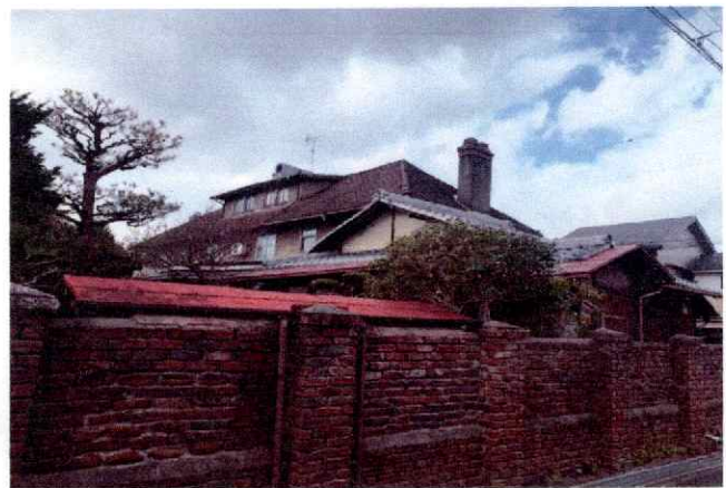
ダブルハウス【1920年 大正9年築】