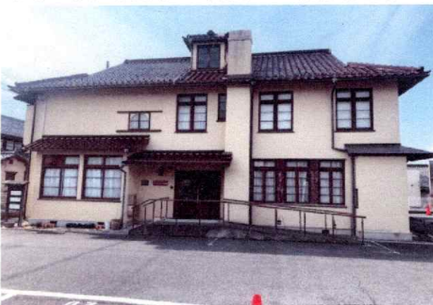
アンドリュース記念館【国登録有形文化財】