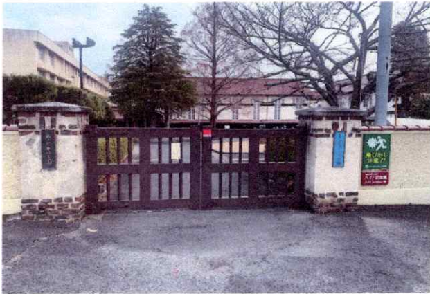
ヴォーリス学園【1967年焼失 1968年新校舎建設】