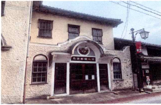
旧八幡郵便局【1921年 大正10年築】