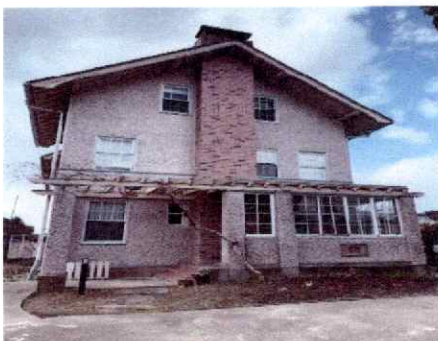
ウォーターハウス記念館【国登録有形文化財】