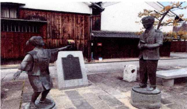
ウィリアム・メレル・ヴォーリズ等身大の銅像