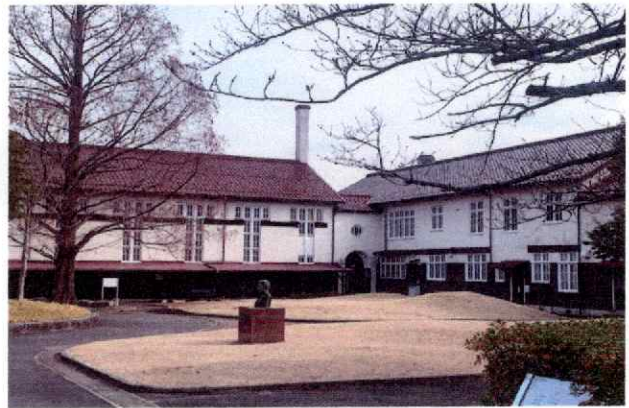
ハイド記念館【ヴォーリス学園内：登録有形文化財】