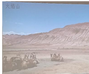
タクラマカン砂漠