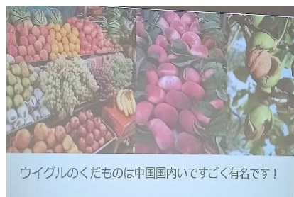
冬はジャムなど保存食に