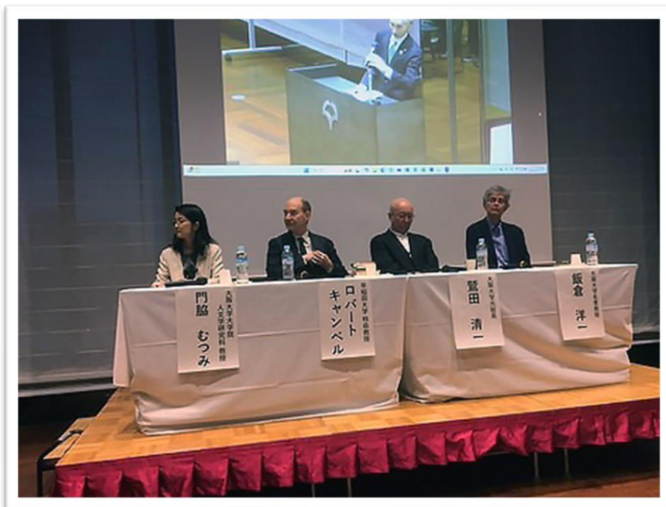
鼎団 阪大中之島センター10階 佐治敬三メモリアルホール