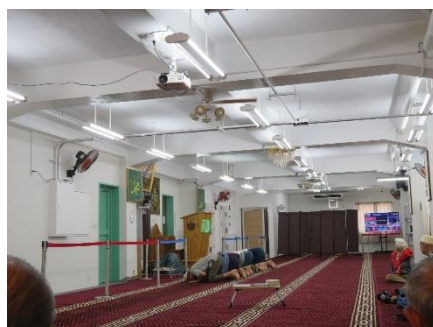
3F 礼拝スペースで礼拝