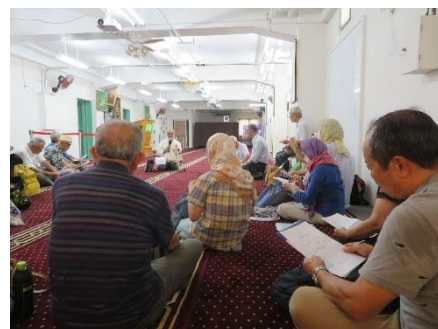
3F 礼拝スペースでお話