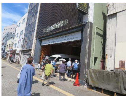
モスクに入ります