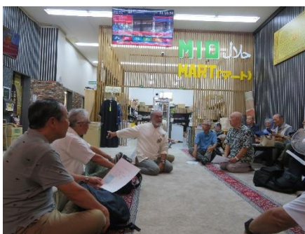
1F ハラール食品ショップ