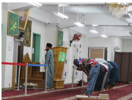
3F 礼拝スペースで礼拝