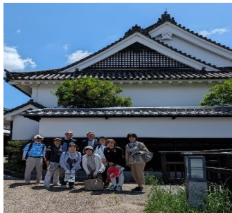
今西家前の記念写真