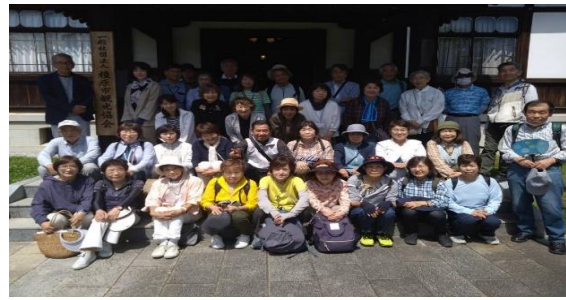
全員参加の集合写真