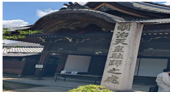
浄土真宗/称念寺/明治天皇ゆかりの地