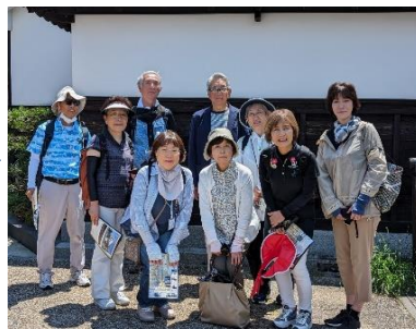
今西家前のクラス写真