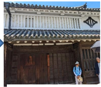
今西家の家紋と馬口