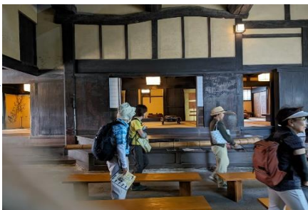
今西家の内部(おしらす) 今日も快晴でした。