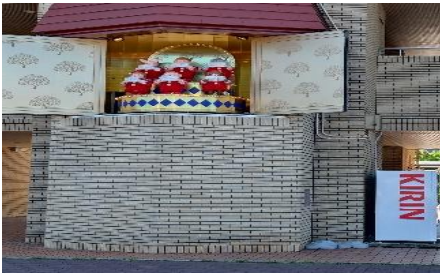
日生中央駅広場で10時過ぎのオルゴール

「黄金伝説の郷」⇒多田銀銅山悠久の館⇒青木間歩 ⇒金山彦神社のコースで、約5kmのウォーキングを楽しんだ。