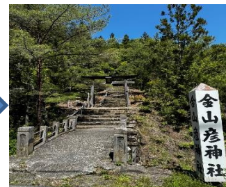
金山彦神社ツアー