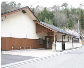
多田銀銅山悠久の館でお昼休みと展示物見