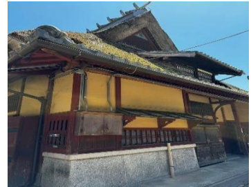
静恩館の見学ツアー