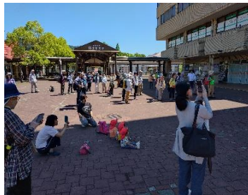
準備体操 1. 2. 3