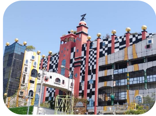
壁の赤と黄色はのストライプは 炎をイメージ