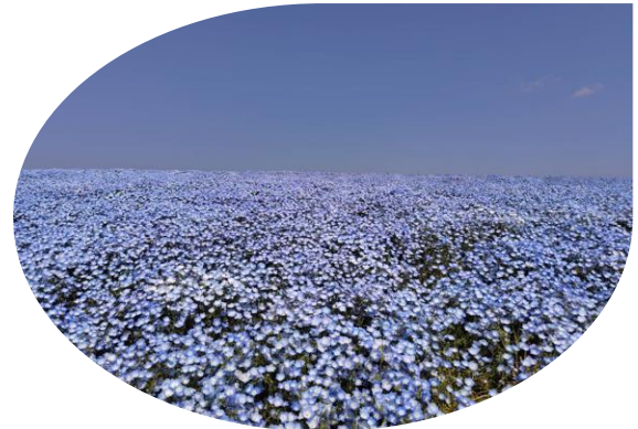
一面に広がったネモフィラは圧巻