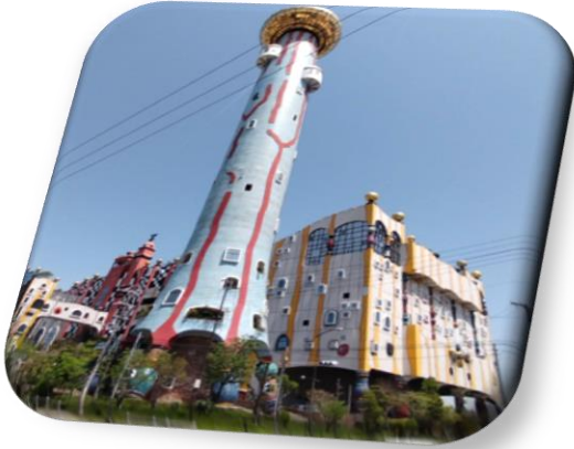
デザインはウィーンの芸術家 【フンデルト・ヴァッサー】