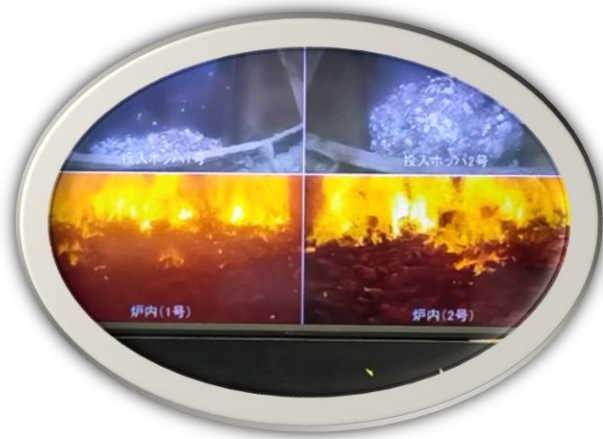
900°Cで燃やす (850°C以上でダイオキシソ が出ない)