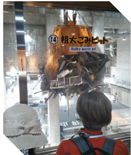
ごみクレーン まるでUFOキャッチャー