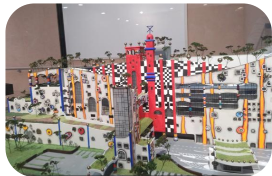
窓は526個、しかし 本物は133個