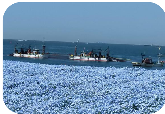
大阪湾の「底引き網漁」とコラボ