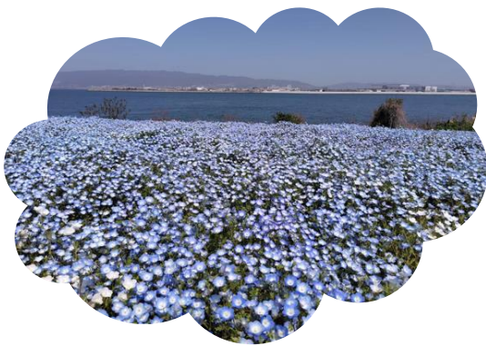
北アメリカ原産のムラサキ科 花言葉は【可憐】