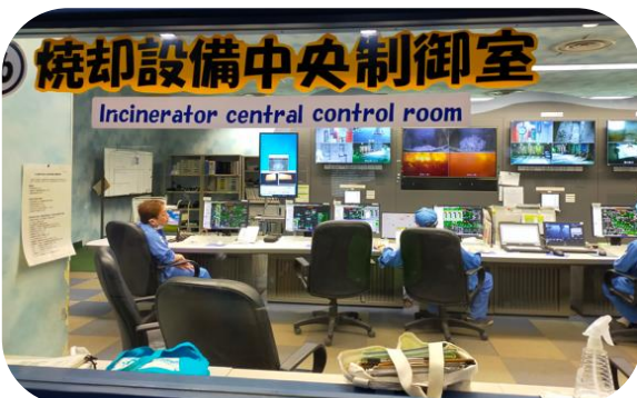
ここで少人数で管理