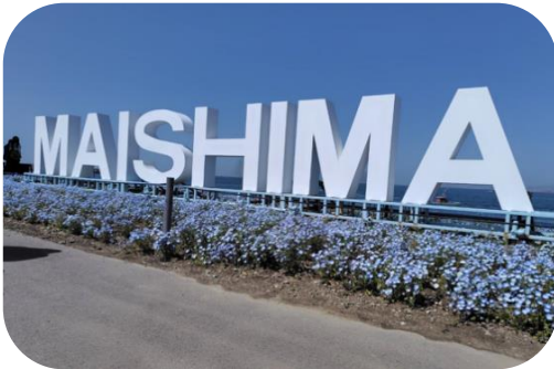
青く澄み渡った空とのハーモニー