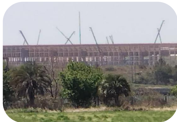
開幕まで1年 大阪関西万博のシンボル大屋根リンク