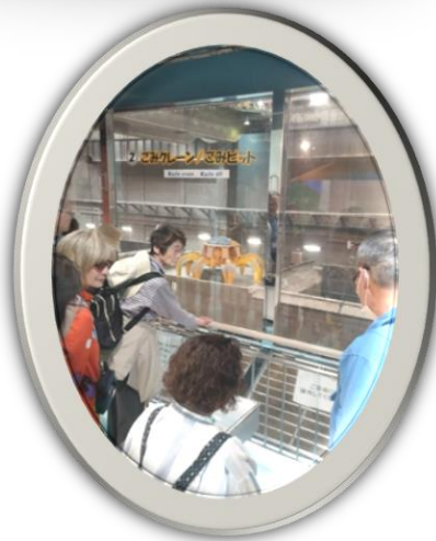
ごみピットをのぞき込み クレーン操縦中