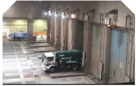
プラットフォームには 1日600台の収集車