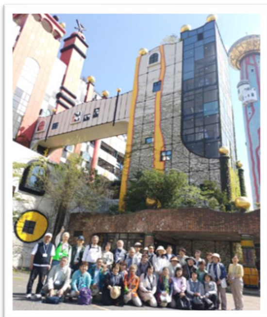
舞洲工場のガイドさんから 施設内や館外も分かり易く 説明して頂きました。 本当にありがとうございました。