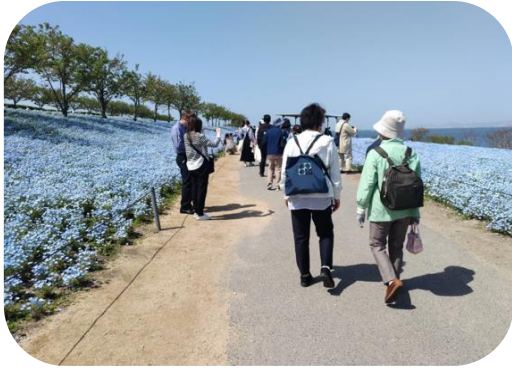
関西最大規模100万株が見頃