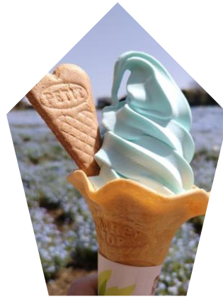
人気No1 ブルーアイ お味はなぜかバニラ味