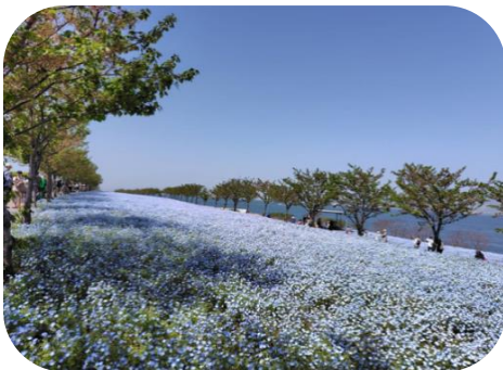
44,400㎡の広大な敷地は なんと👉甲子園球場の3個分👈