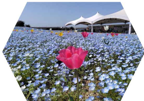
ネモフィラとチューリップの コラボレーション