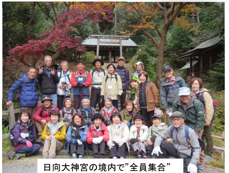
日向大神宮の境内で”全員集合”