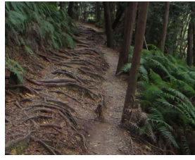
木の根っこが凄い