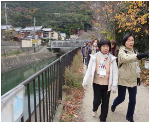
毘沙門堂下から第2トンネルまで約2.2kmを散策する。 疎水は明日水抜きですって!! 見れてラッ