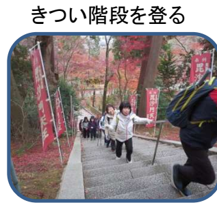
きつい階段を登る