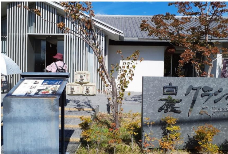
白鹿クラシックス (レストラン)