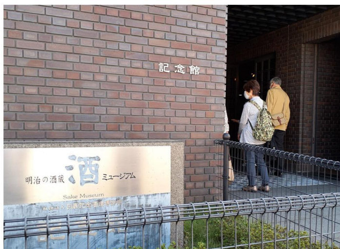
酒ミュージアム 記念館