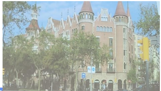
ガウディではないが素敵な建物が多い