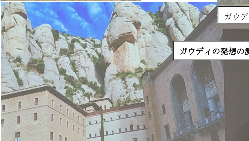
ガウディの発想の源とされる洞窟 山モンセラート