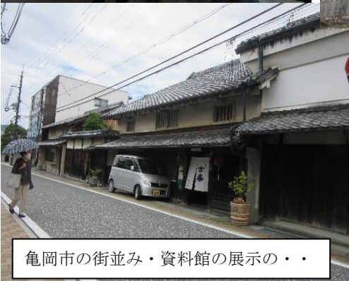
亀岡市の街並み・資料館の展示の・・・