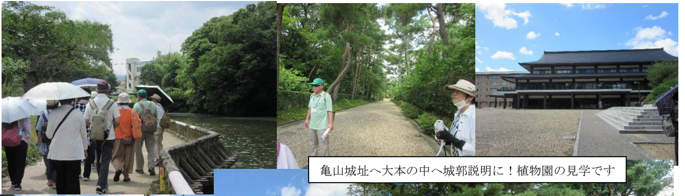
亀山城址へ大本の中へ城郭説明に！植物園の見学です