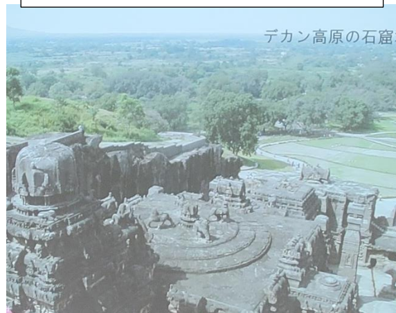
デカン高原の石窟群