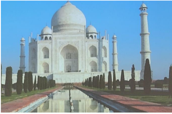
タージマハル・・・

18 世紀以降イギリスの統治下になり建物もイギリス王朝の建物が増えた。場所の名前も コルカタ・・・カルカッタ チェンライ・・・マドラス ムンバイ・・・ボンベイなどとインドの読み方に変わっていった。 コルカタ中央駅は車でホームまで行くことができる ・・・イギリス統治のなごり・・・