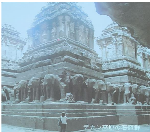
デカン高原の石窟群

頭にターバンを巻いているのはシー ク教・・・髪の毛を切らないのでター バンを巻いて止めているのだそう・・・