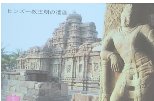
ヒンズー教王朝の遺産