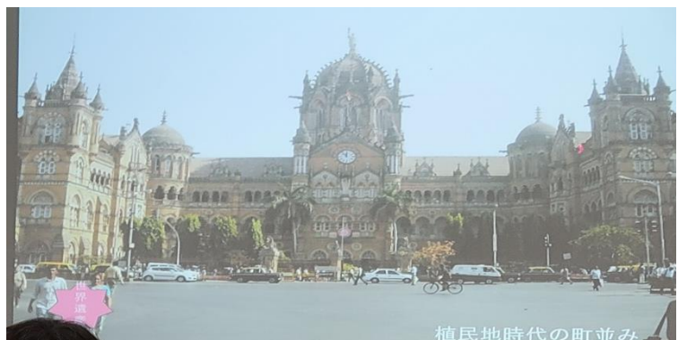
植民地時代の町並み