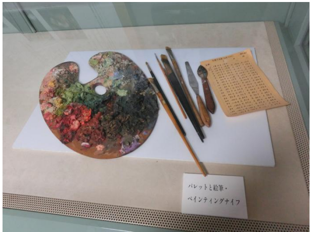
パレットと絵筆、 ペインティングナイフ

アトリエの中には、実際に小磯良平氏が使用したイーゼルやパレット、モチーフとなった楽器や人形、家具が展示されて制作当時の雰囲気を感じられます。