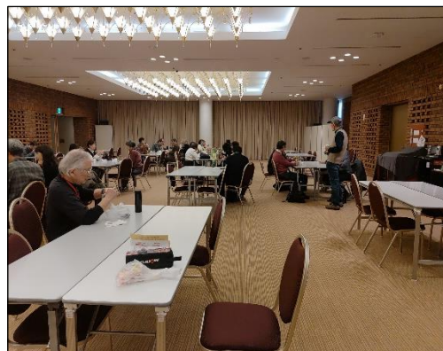
3F レセプションルームの様子