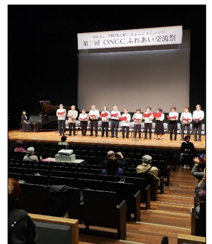
パフォーマンスの最終は「いきいき！ ボイストレーニング」のコーラス でした