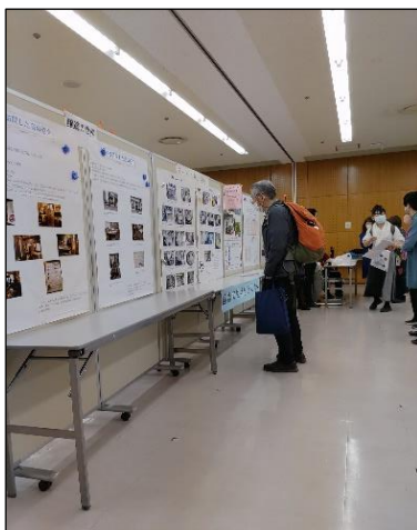
醸造科ブースの様子