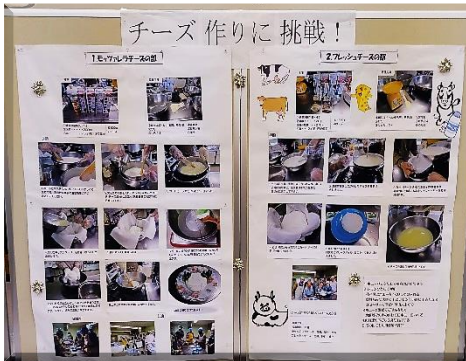
2班のパネルは「チーズ作りに挑戦」 です