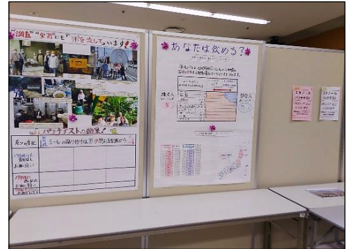
3班のパネルは「楽しい醸造」と題し 酒に強いか弱いかを判断するパッチ テストの実施です