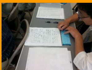
点字機で文字 を入力風景