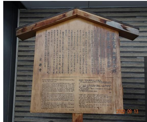
坂本龍馬は近江屋の二階で中岡慎太郎と共に暗殺された