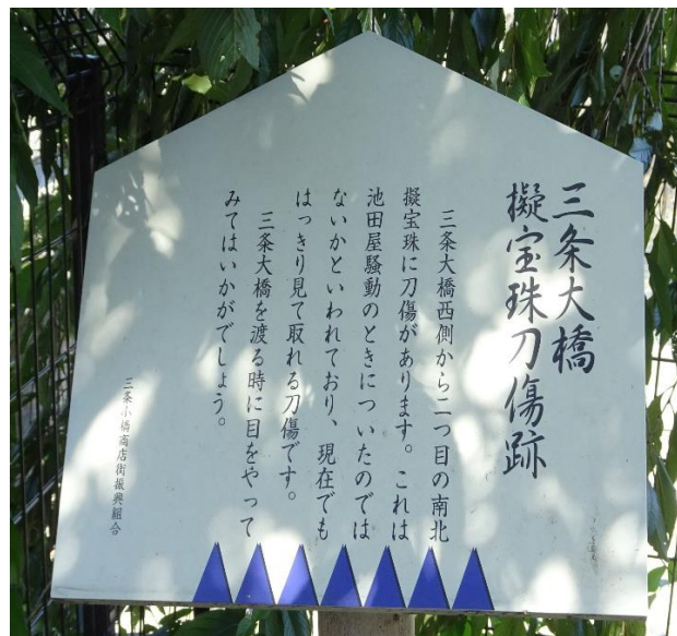
刀傷痕の残る三条大橋の擬宝珠とその説明看板