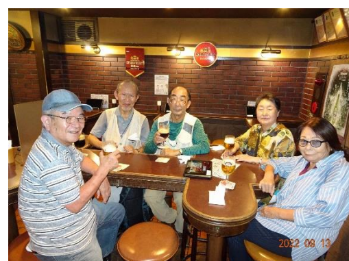
称名寺前をって見学会を終了。反省会で喉をうるおわせた。