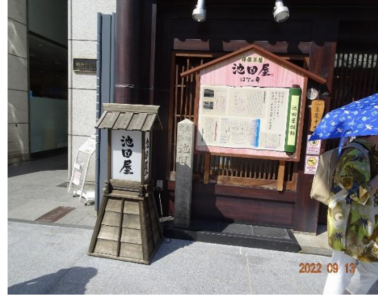
元の池田屋は廃業。現在は居酒屋「池田屋はなの舞」が営業中