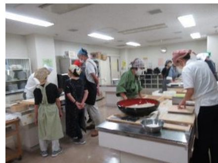
3Gr に分かれ、各指導者の元実習開始