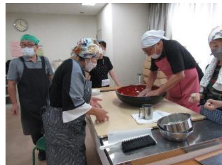
第 3Gr の「こね」の作業中写真