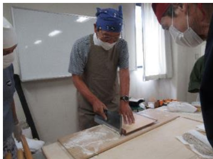
第 2Gr の「切る」の作業中写真