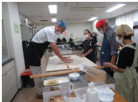
第 1Gr の「のばし」の作業中写真