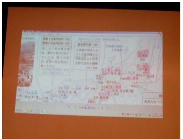
本日の講義「禁門の変」のパワーポイント