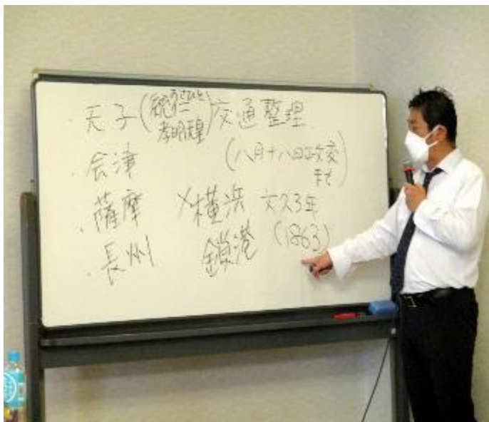
「八月十八日の政変まで」の交通整理と説明