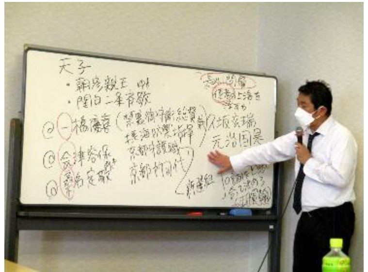
「新選組」と会津藩の関係の説明など