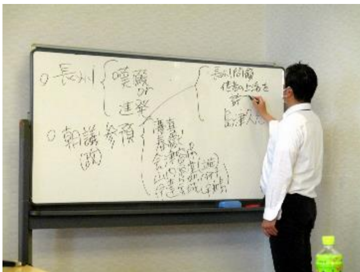
長州の嘆願・テロと進発の関係の説明など