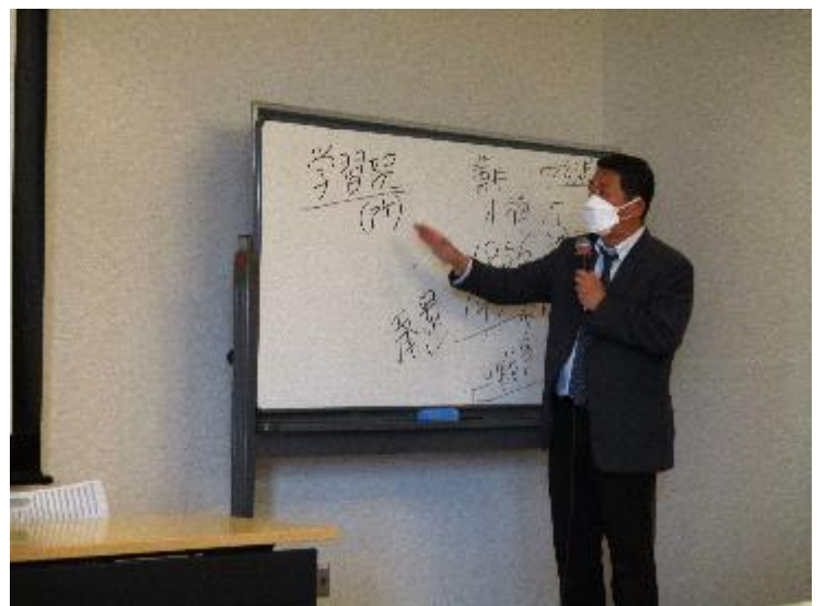
学習院(所)の説明(渋沢栄一の例を上げ)