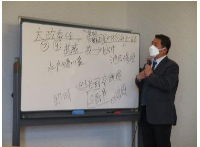
大政委任と水戸家の日本外史の關係の説明