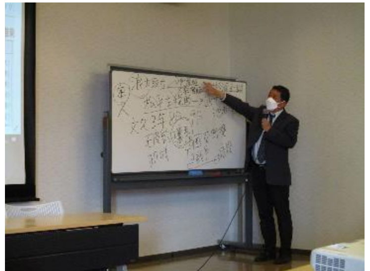
浪士取立で尊王浪士の概略と新選組の説明