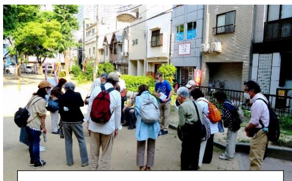
ゴールで、案内の3人にお礼を