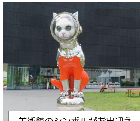
美術館のシンボルがお出迎え