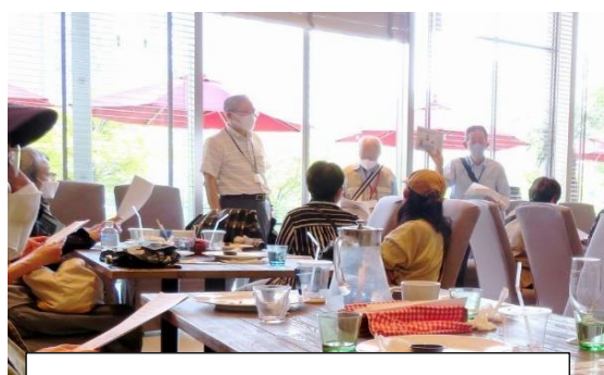
散策コースの説明を聞いています

その内の某店に突入し、左党一同が喉の渴きをアルコール で潤し、四方山話に興じた次第。