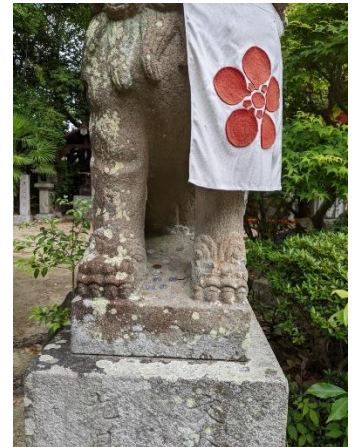
臂岡天満宮の狛犬

余談ですが、臂岡天満宮の狛犬は辛うじて性別のわかるものでした。 これは珍しく、数の少ないものだそうです。 興味のある人は見に行かれてはいかがでしょうか。