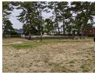
伊丹廃寺五重塔跡

緑ヶ丘公園到着後、そこで解散となり、本日はこれで終了となりました。次回探訪は伊丹市で、清酒発祥の地コースの予定です。お楽しみに。