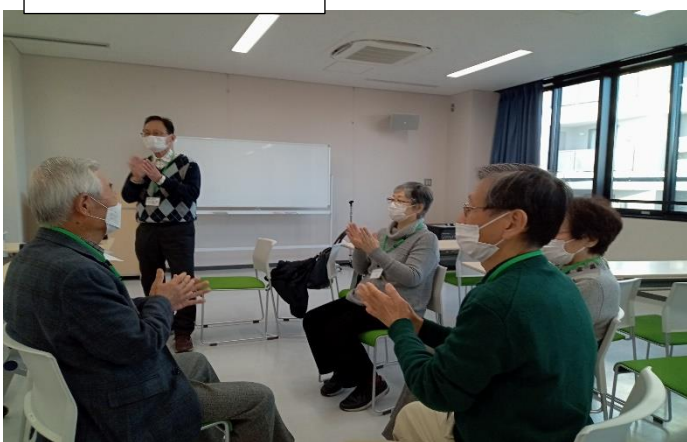
期末テスト？先生の話、聞いても覚えていないもんだ！