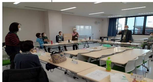
グループ対抗 お菓子の争奪戦じゃんけん