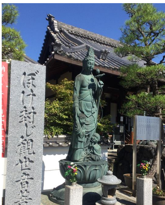
勝運・ぼけ封じのお寺と言われる勝龍寺。