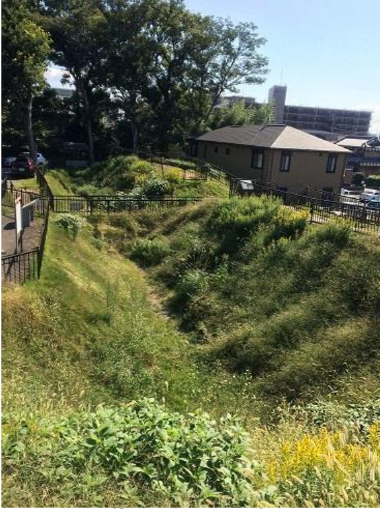
勝龍寺城の土塁空堀

本日の校外学習は、全員の希望を集約した結果、勝竜寺城公園とその周辺史跡の探訪となりました。班長・副班長グループ等により具体的な行程表を作っていただきました。