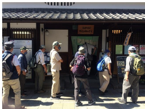
旧石田家住宅を長岡京市神足 ふれあい町家として活用

いつもより早く、午前中で JR 長岡京での解散となりました。全体の解散後に昼食を一緒に食べた班もありました。