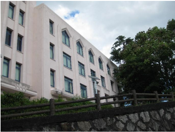
旧浪花高等学校校舎（三角窓）