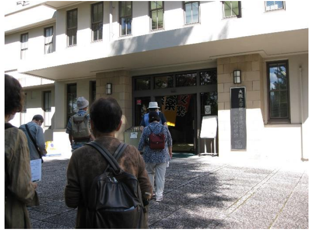
大阪大学総合学術博物館見学