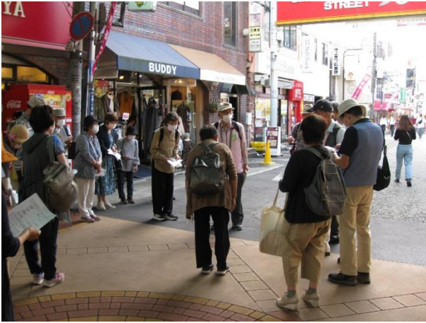
阪急電車石橋阪大駅前でルート説明