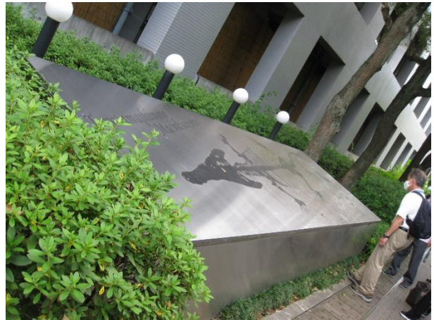
マチカネワニ化石出土地点