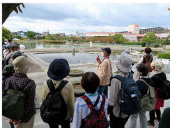
市場池オアシス広場