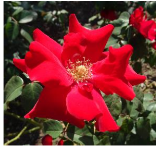
シティ・オブ・バーミンガム