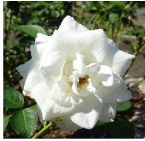
ホワイト・アロー