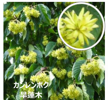
カンレンボク 早蓮木