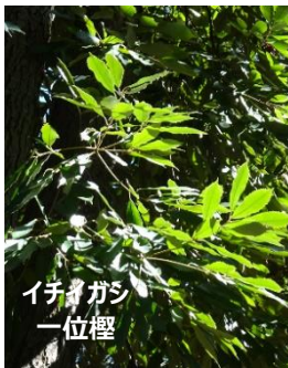
イチイガシ 一位櫻