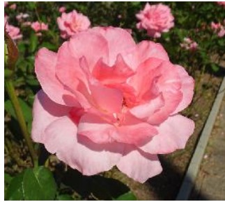
クイーン・エリザベス