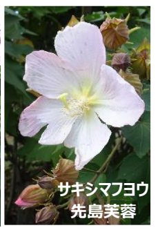
サキシマフヨウ 先島芙蓉