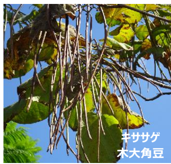
キササゲ 木大角豆