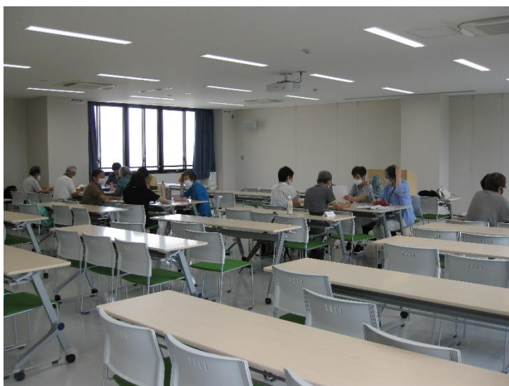
4班に分かれての今後の活動協議