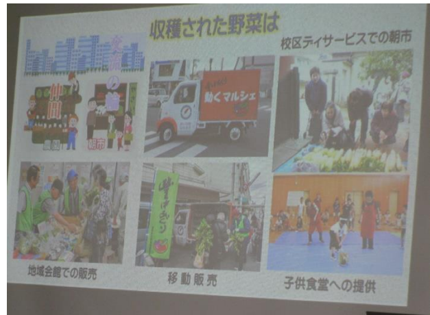
収穫した野菜の提供先は？