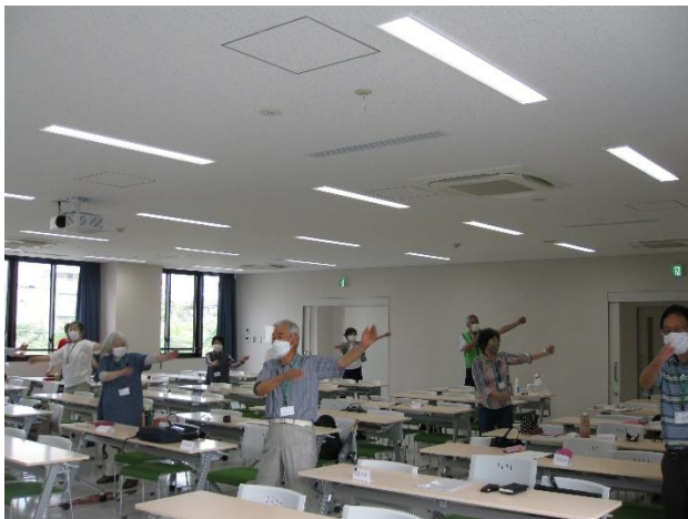
午後のスタートはラジオ体操から