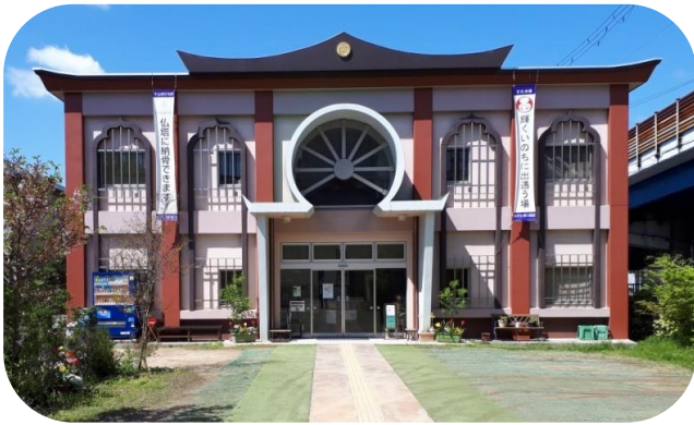
教室は「ナムのひろば文化会館」のサンガホールです（池田市）