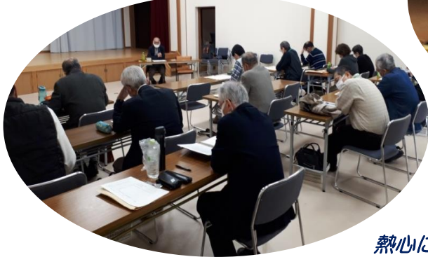
熱心に聴講される受講生の皆さん