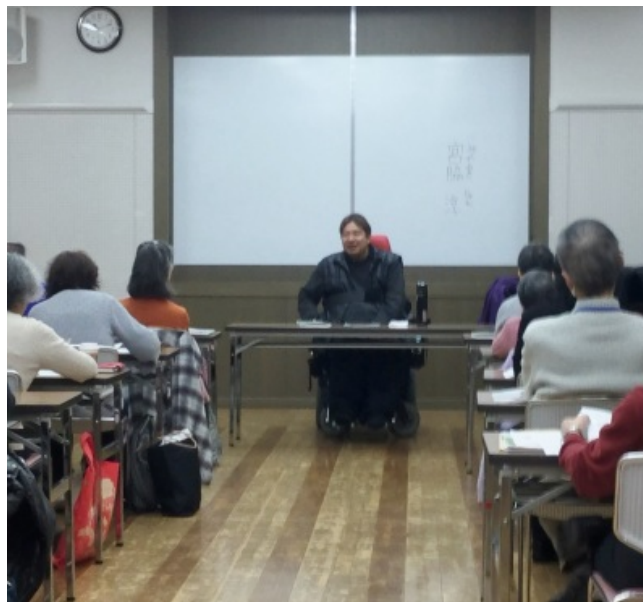
「障がい者の人権・理解・心理」などについて：自身の車いす生活体験を通しての話