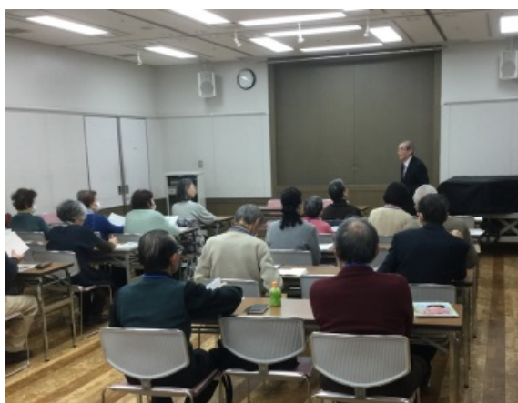
船本理事長 開講あいさつ