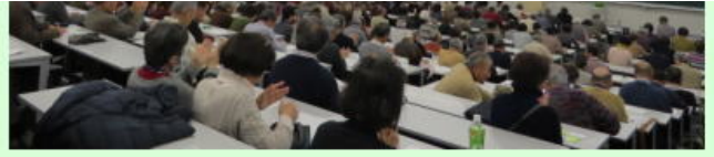
佐保田副理事長 謝辞