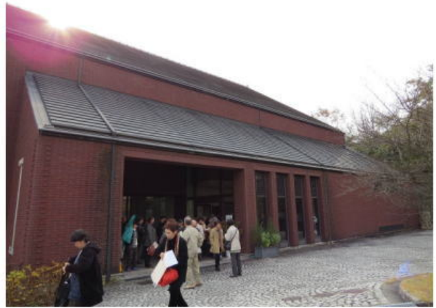
澤山記念館を後に