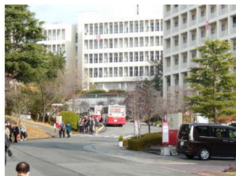
梅花女子大学 スクールバスで到着