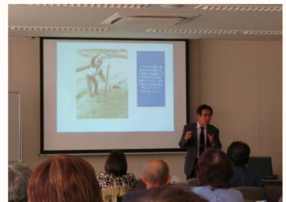
1986年2月、竪穴式住居跡で話題となった藤井寺市の近鉄B梨田邸について