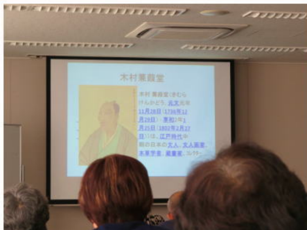
木村兼葎堂について