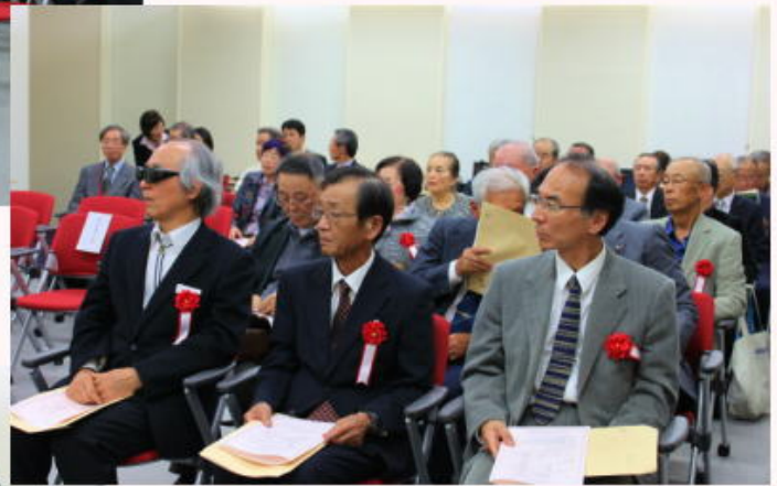
ご来賓・講師の方々