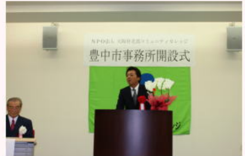
南 関西アーバン銀行豊中支店長