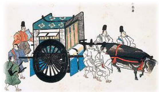
半部車 (はじとみぐるま)

第12帖『須磨』— 飛ぶ鳥を落とす勢いであった光源氏は誰も訪ねて来ない須磨での侘び住まいを経て魅力ある大人として成長していく時代—