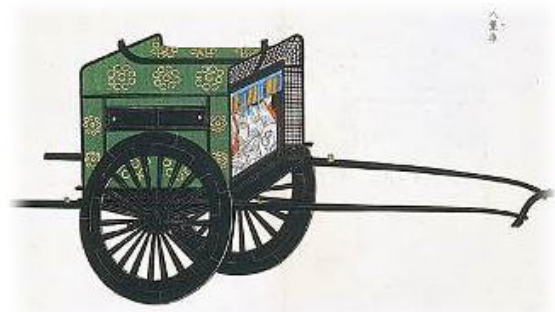
網代車 (あじろぐるま)