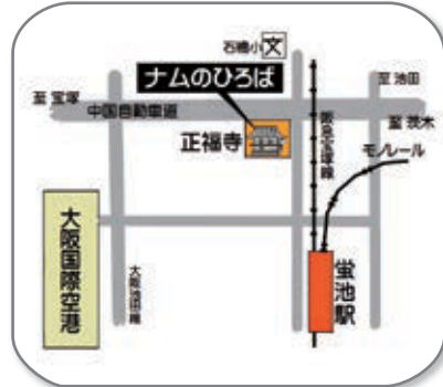
池田市石橋4-15-14 (駅北8分)