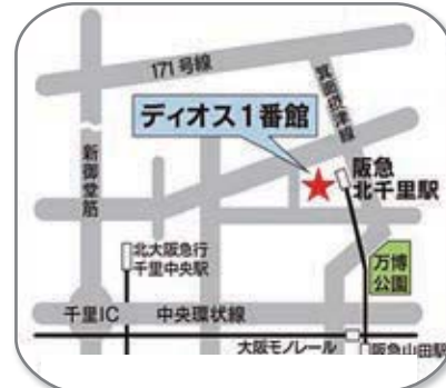
吹田市古江台4丁目119番地 (北千里駅 駅ビル)