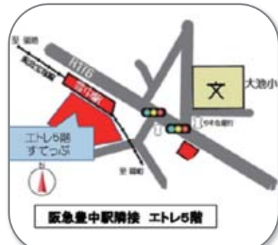
豊中市玉井町1-1-501 (駅南隣接ビル)