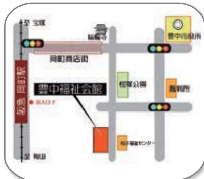
豊中市中桜塚2丁目28-7