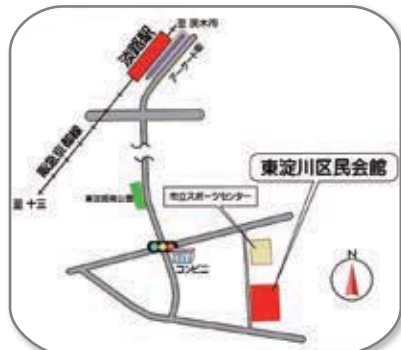
大阪市東淀川区東淡路1丁目4-53 (淡路駅南11分)