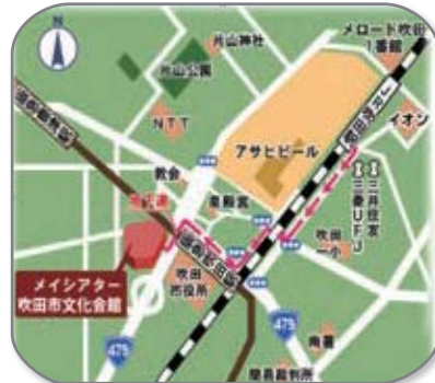
吹田市泉町2丁目29番1号 (阪急吹田駅1分)