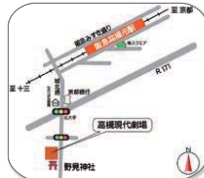
高槻市野見町2-33 (駅南7分)