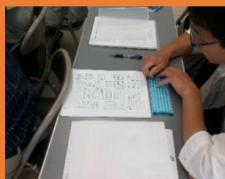
点字機で文字 を入力風景