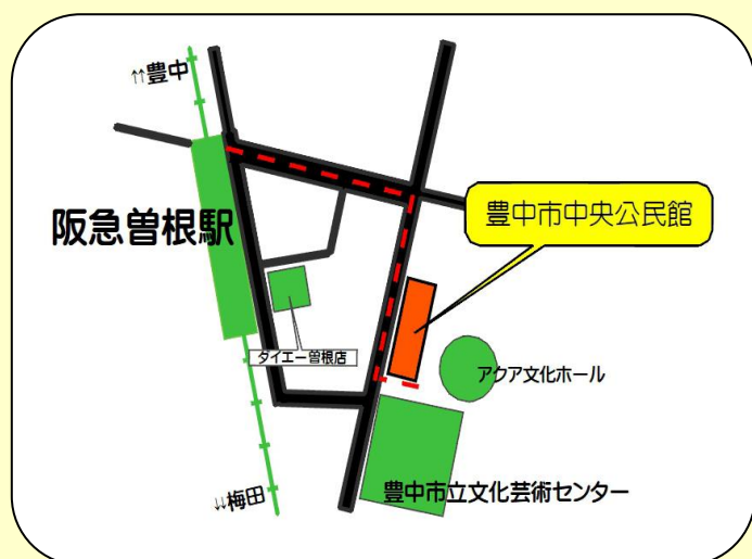
豊中市中央公民館(文化芸術センター横)